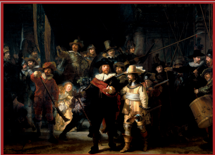
Ronda di notte. REMBRANDT, 1642. Olio su tela - Rijksmuseum, Amsterdam The Night Watch. REMBRANDT, 1642. Oil on canvas - Rijksmuseum, Amsterdam