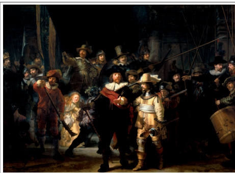
Ronda di notte. REMBRANDT, 1642. Olio su tela - Rijksmuseum, Amsterdam The Night Watch. REMBRANDT, 1642. Oil on canvas - Rijksmuseum, Amsterdam

EUROPEAN and ITALIAN INSURANCE MARKET: vigilance reliability and consumer protection